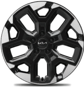
Rin de aluminio de 18" bitono EX, EX PACK