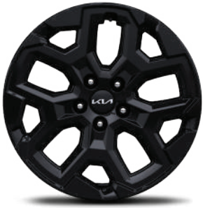
Rin de aluminio de 18" en acabado negro SXL