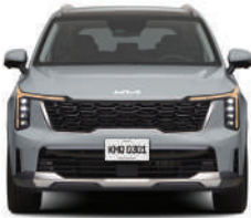
Wolf Gray (EX, EX PACK, SXL)