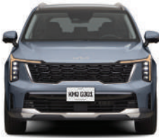
Everlasting Gray (EX, EX PACK, SXL)