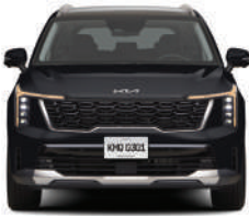
Pantera Metal Gloss (EX, EX PACK, SXL)