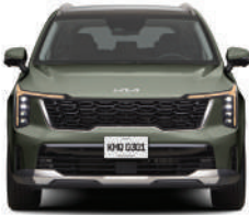
Jungle Wood Green (exclusivo SXL)